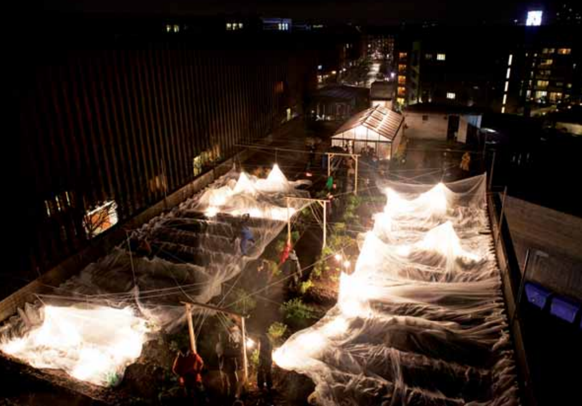
Vintersolhverv på ØsterGro. I december 2015 lagde det storstilede urban farming-initiativ ØsterGro for tredje år i træk tag til Platants vintersolhvervsfest.

ne lege i og få varmen, og som samtidig kunne stilles op, så de gav lune siddemuligheder og ikke mindst læ.