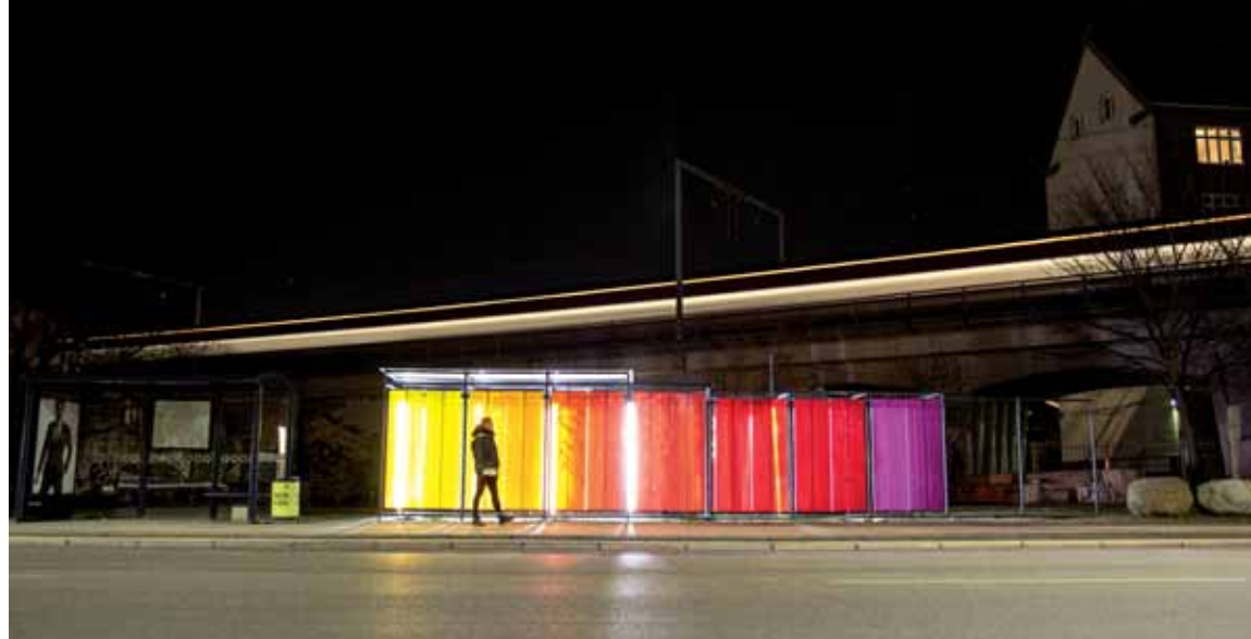
Glenteparken er en lommepark i København der i høj grad også fungerer som transitstede mellem den travle Nordre Fasanvej og højbanen. Derfor tog Platant fat i busskuret som hele året rundt er base for brug af byrummet og undersøgte om andre materialer og funktioner kan gøre den kolde ventetid lidt rarere eller mere underholdende. Entreprenør: RS Entreprise. Arkitekt: Platant.

„Det handler om at gøre tingene på vinterens præmisser og eksempelvis iscenesætte mørket. Derfor arbejdede vi også meget med lys og farver. I København er der generelt