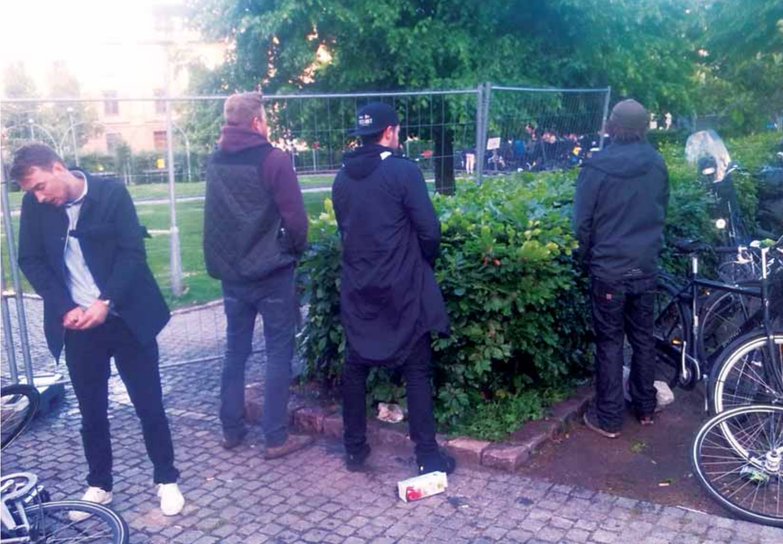
Puha, nu kunne Tissetester 1 og Tissetester 2 altså ikke holde sig længere. Heldigvis ser beplantningen ud til at kunne tåle mosten.

toiletet. Tisstrængende mænd kan gå ud, lyne ned, tisse i pissoiret og gå tilbage igen," skrev hun. „Når jeg er i byen og skal på toiletet, er det præcis dét jeg vil. Jeg vil tisse. Jeg vil ikke sætte hår, rette make-up eller snakke. Jeg gentager: Jeg vil tisse. Hvorfor er der ikke pissoirer til kvinder endnu? Hvorfor kigger jeg ikke ud af vinduet fra Mal-