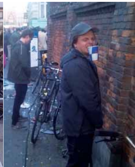
Tissetester 2 skal lige have en hurtigt tissetår, og SÅ videre.