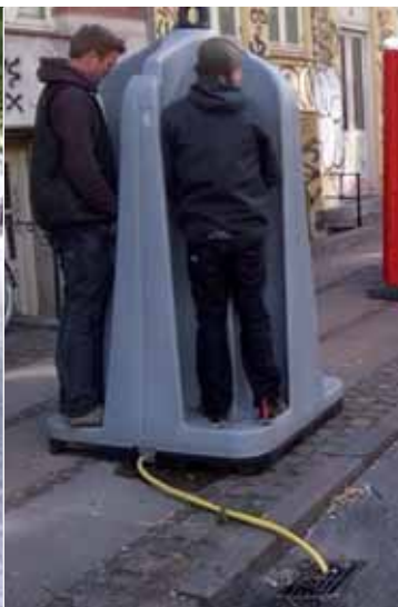
Nu kan Tissetester 2 ikke holde sig mere. Bemærk tilkoblingen til kloak.