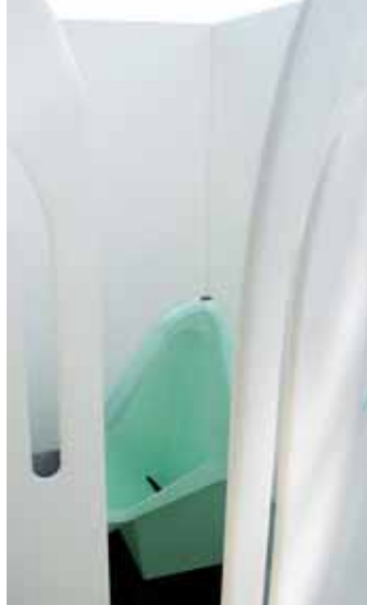
Godt gang i pige-pissoiret Pollee til Distortion i 2013.

Noget lignende skete i København i 2011 hvor studeren-