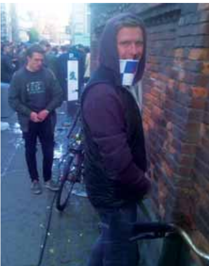
Vent, lige en tissetår først, og Grønt Miljø udsendte er igen klar.

gernes udfordringer alvorligt nok. Jeg fik idéen på Roskilde Festival med min kæreste hvor jeg oplevede de totalt kritisable forhold som hun måtte tisse under. Og ikke mindst bliver hele arrangementet jo påvirket af at man ved at 45 minutter efter at man har taget en fadøl, skal man stå i kø i 45 minutter. På den måde bliver hele dagen jo præget af tisse-