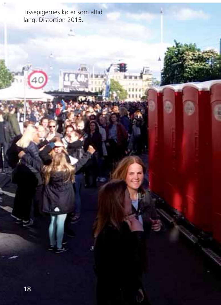
Tissepigernes kø er som altid lang. Distortion 2015.