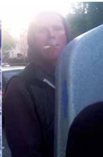
En diskret tår og så hurtigt videre. Når en mand skal, så skal han.