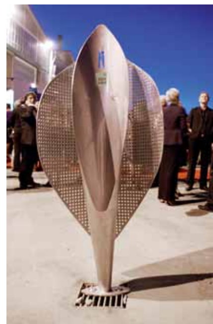
UiWE vil aftabusere tissesituationen, bl.a. med produkter hvor æstetikken har fået en fremtrædende rolle.