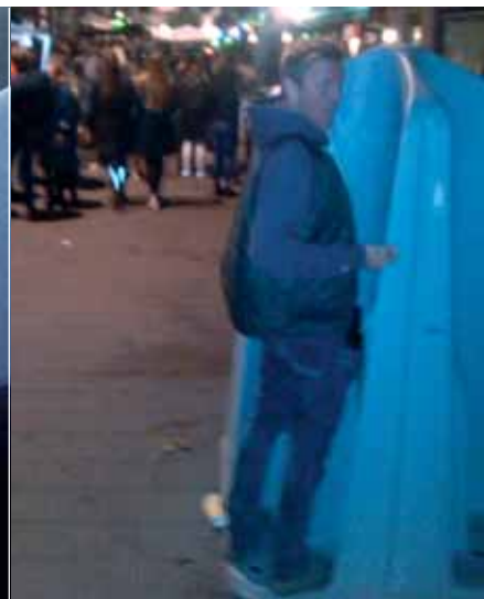
Der havde jeg sgu nær pisset i bukserne.