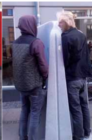
Tissetester 1 finder i tide et pissoir, men en tændt nabo forstyrrer.