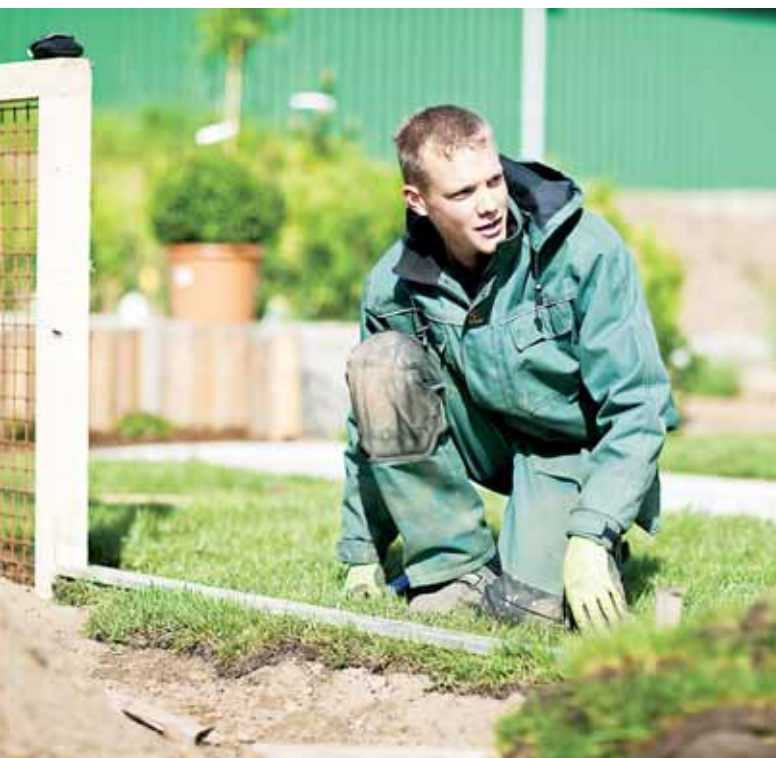
Skolepraktik kan være meget godt, men man oplever ikke arbejdskulturen uden for skolen.

På blivanlaegsgartner.dk er der alle informationer som man som elev, virksomhed eller skole har brug også i forhold til praktik. □