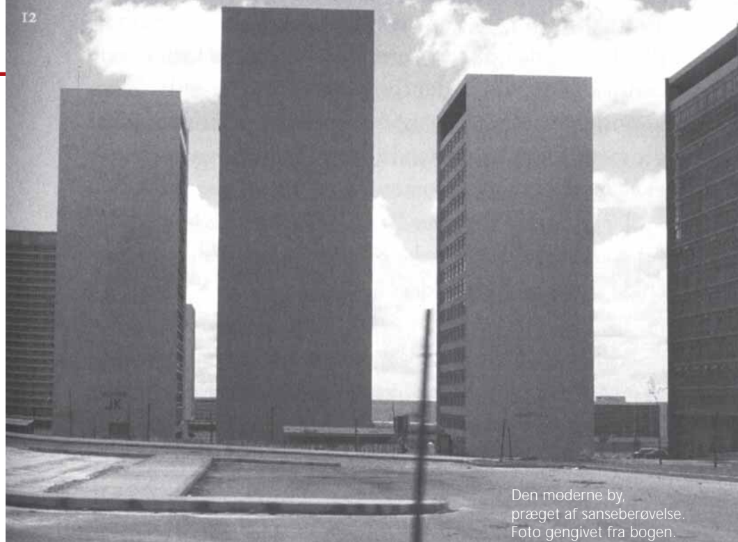
Den moderne by, præget af sanseberøvelse.

• Forfatteren besøger 30 engelske landhaver, herunder kendte som Hidcote and Great Dixter og mere ukendte, alle i klassiske stilarter. 'A fresh look at the English country house garden' meddeler forlaget.