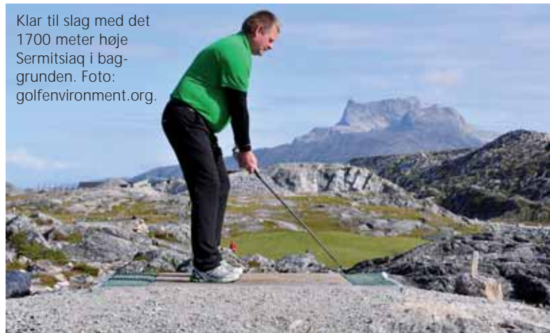
Klar til slag med det 1700 meter høje Sermitsiaq i baggrunden.

Der er ikke drænings- eller vandingsanlæg på banen i Nuuk. Der vandes kun i for-